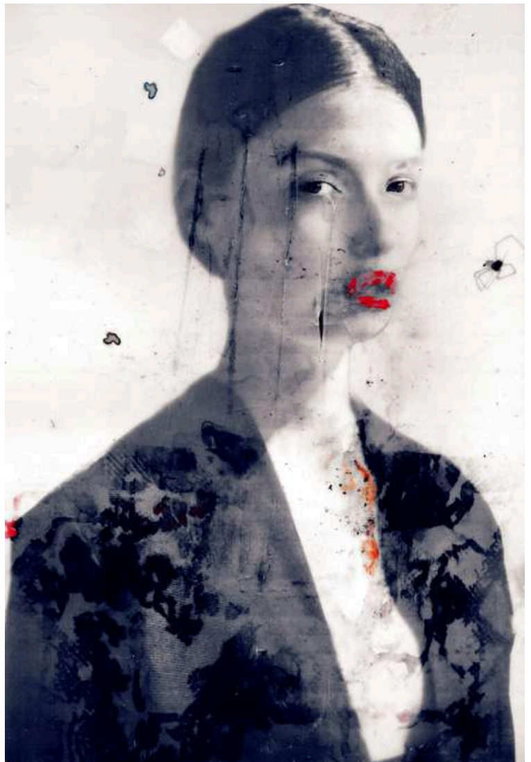
SHE WANTED (2016) cm 64x94 2 prova d'artista Stampa su carta baritata montata su Dibond