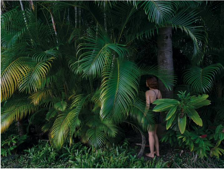
GATEWAY, 2023 98 x 131 cm, edizione di 7 dalla serie Hiding from the Sun