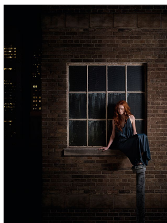
pagina precedente: I CAN FEEL THE UNIVERSE , 2015 65 x 87 cm, edizione di 5 dalla serie Behind the Visible