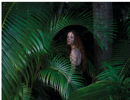
← in copertina THE LIGHTHOUSE , 2023 98 x 131 cm, edizione di 7 dalla serie Hiding from the Sun