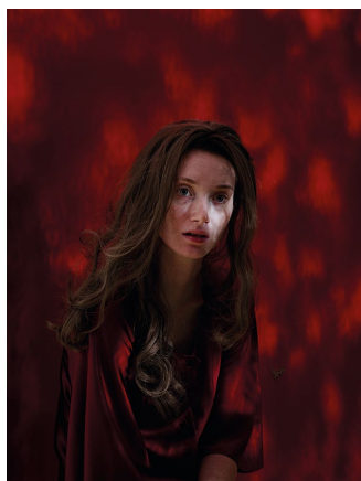
PREMONITION , 2015 87 x 65 cm, edizione di 5 dalla serie Behind the Visible