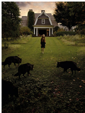
CALL OF THE WILD , 2015 131 x 98 cm, edizione di 7 dalla serie Behind the Visible