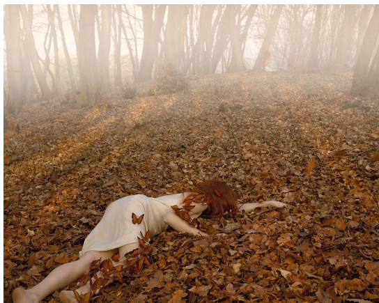
WANDERING SOULS , 2014 94 x 141 cm, edizione di 7 dalla serie Behind the Visible